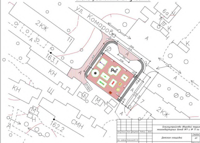
Схема расположения участка