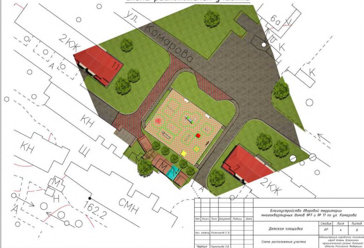
Схема расположения участка